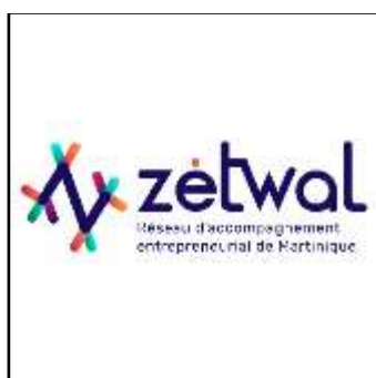
Site de la collectivité territoriale de Martinique https://www.zetwal.mq