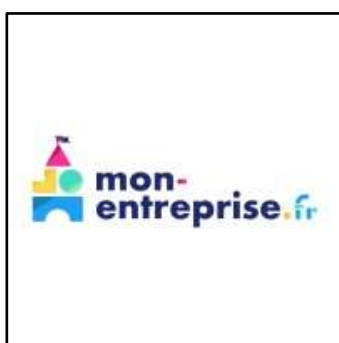
Simulateurs en ligne pour aider les dirigeants https://mon-entreprise.urssaf.fr