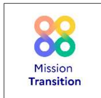
Moteur de recherche pour les aides dédiées à la transition écologique https://mission-transition.beta.gouv.fr