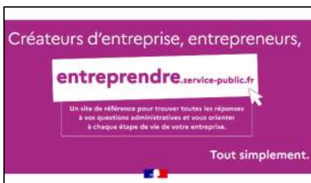
Site d'informations https://entreprendre.service-public.fr

Pour démultiplier son impact , le service a donc vocation à être accessible depuis toutes les ressources destinées aux entreprises. La priorité a été de l'intégrer sur le site d'information et d'orientation des entreprises entreprendre.service-public.fr . Dans une logique d'État plateforme, le service est également présent dans d'autres outils thématiques (simulateur pour l'embauche d'un salarié, moteur de recherche d'aides à la transition écologique) ou portés par des collectivités territoriales comme la Martinique.