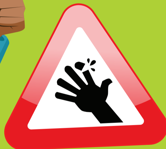
Blessure à la main