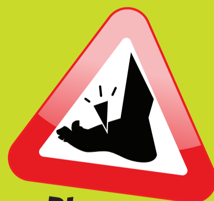
Blessure au pied